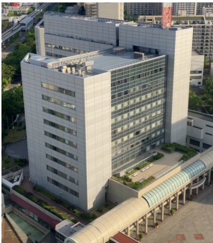
(神戸コンベンションセンター外観)