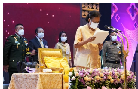
H.R.H. Princess Maha Chakri Sirindhorn